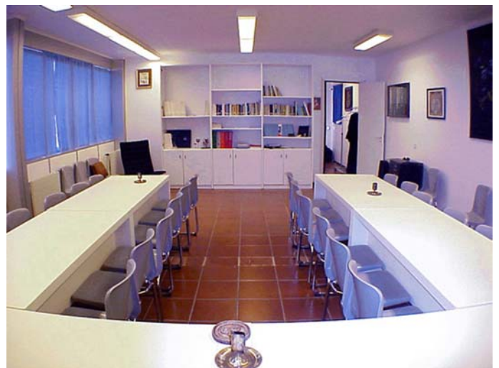
Sala Conferenze Vista Ovest