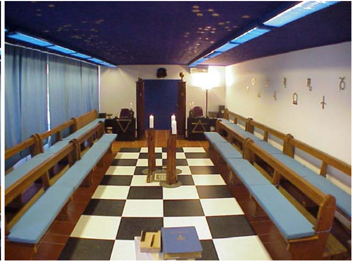
Tempio Vista ad Occidente