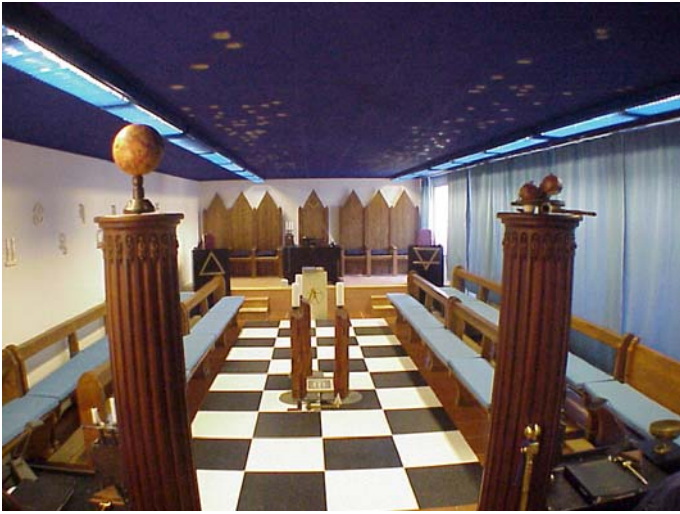
Tempio Vista ad Oriente