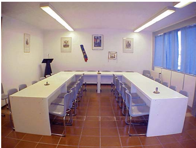
Sala Conferenze Vista Est